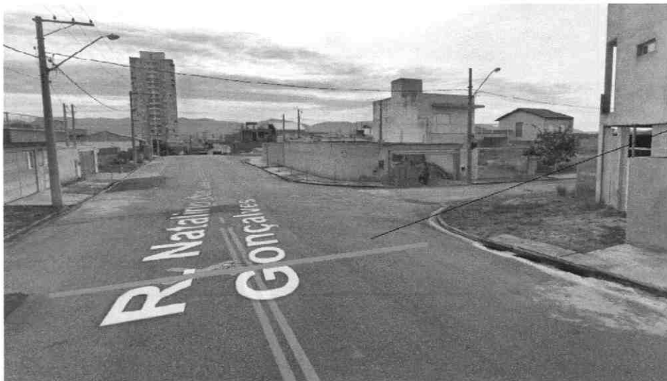
Altura do número 770