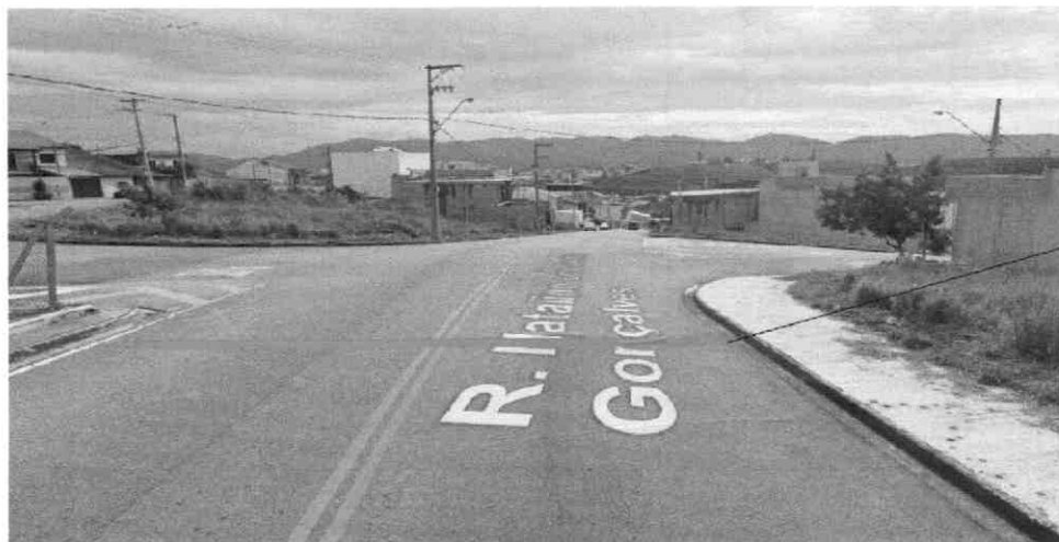
Altura do número 350